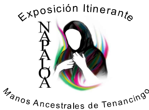
Imagen y Slogan