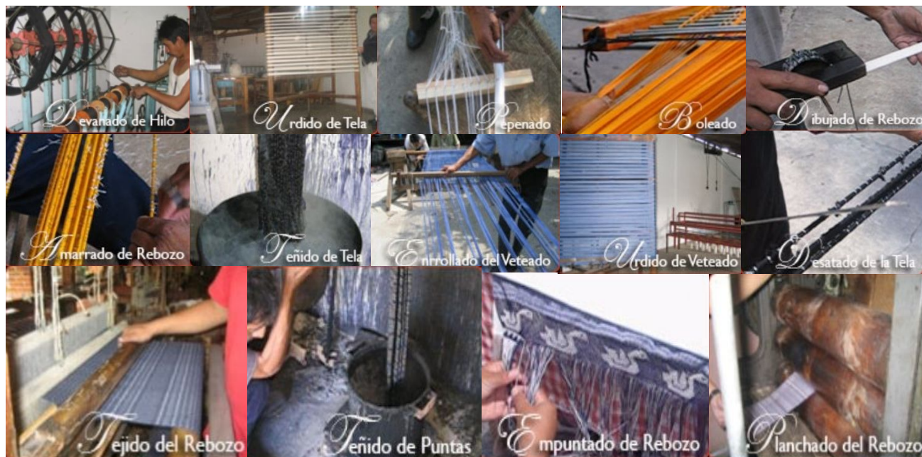
PAGINA WEB REBOZOS DE TENANCINGO

Para el teñido de los hilos se utiliza la técnica de ikat , es decir, anudando la madeja antes de la inmersión en colorante para lograr el reservado que caracteriza al jaspeado de los rebozos. Ya teñida la madeja, ésta se pasa al urdidor, del cual se articula un telar de cintura. Una vez en el telar, se comienza a tejer, tarea que dura aproximadamente sesenta días.