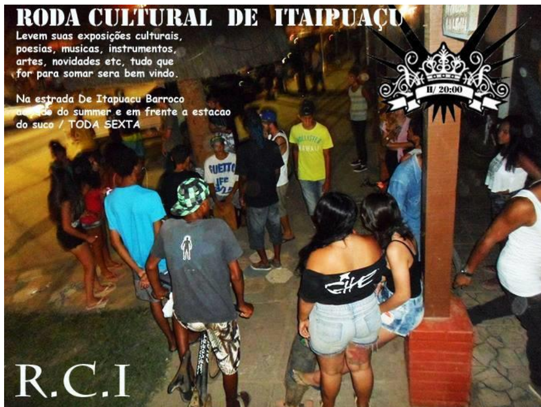
Imagem 4. Batalha de Rima (ou Roda Cultural, ou Roda de Rimas) em Itaipuaçu (Maricá, RJ)

A discussão da autora nos é útil ao pensarmos a realização das rodas culturais em diversas cidades. As rodas vêm requalificando praças e aglutinando jovens ao redor das disputas de rimas, mas são mal vistas e constantemente abordadas por patrulhas policiais, ou mesmo rejeitadas por comerciantes próximos com argumentos preconceituosos, como vimos acontecer em Itaipuaçu, no município de Maricá, estado do Rio de Janeiro/RJ (Brasil). Estes eventos culturais têm sido palco de efetivas apropriações de espaços urbanos coletivos, muitas vezes relegados pelos poderes públicos e sem qualquer uso, mas –como aponta Miraftab– são espaços inventados , “afetados” por ideais de criminalização.