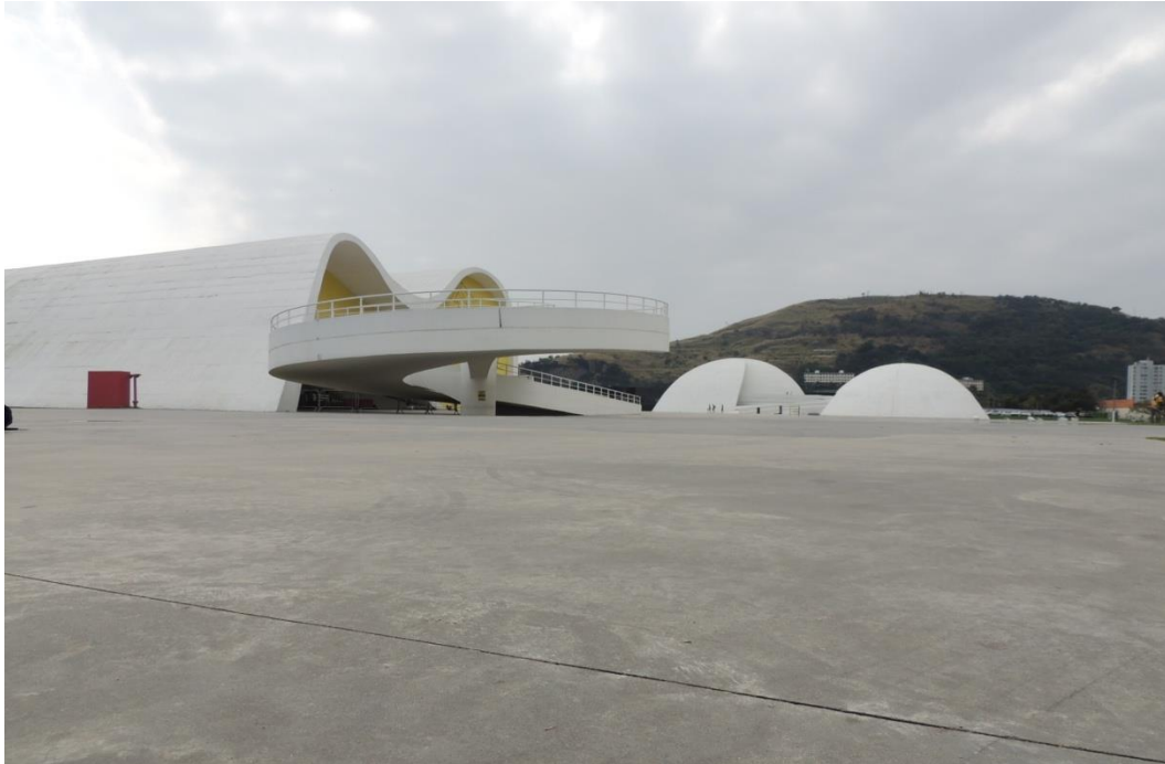
Imagem 2. Parte do Caminho Niemeyer onde se pode ver o piso em plaqueado cimentado o qual os skatistas buscam utilizar e são reiteradamente coibidos