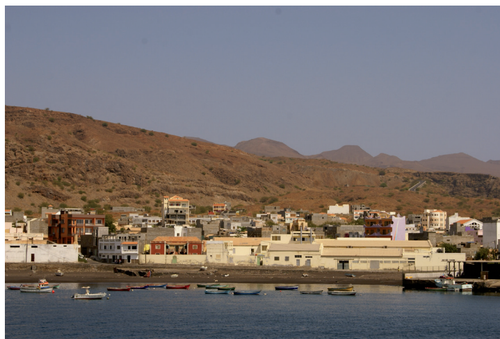
Figura 1. Visión panorámica de los edificios de la fábrica antes de la intervención. 2012.

Está desarrollándose desde 2012 el proyecto Museo de la Pesca (en portugués Museu da pesca; en adelante MP), en Tarrafal, Isla de São Nicolau, Cabo Verde. Este es fruto de una colaboración público-privada entre el IIPC (Instituto de Investigación y Patrimonios Culturales), el M_EIA (Instituto Universitario de Arte, Tecnología y Cultura) y la empresa conservera SUCLA (Sociedad Ultramarina de Conservas).