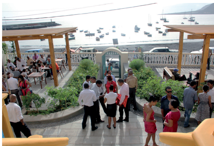
Figura 4. Espacio exterior del Museo de la Pesca el día de la inauguración. 2015 Archivo M_EIA.

A nivel conceptual, el M_EIA – consciente de los desafíos de la museología contemporánea en el mundo y en particular en Cabo Verde – tuvo un papel preponderante. El proyecto científico está basado en el concepto de Nueva Museología, donde el compromiso claro con el territorio, la comunidad y el patrimonio de Tarrafal, en particular, y de São Nicolau, Cabo Verde, constituyen las ideas y propuestas de participación del M_EIA en el proyecto. Esta visión ha desencadenado la búsqueda de condiciones para un nuevo modelo de conservación, gestión y comisariado, capaces de garantizar la concepción y ejecución de los cinco ejes definidos del Diseño de la Programación: educativo, científico, cultural, económico y promoción social; entre los que se encuadran la exposición permanente, exposiciones temporales, seminarios, aulas, servicio de intercambio nacional e internacional y tienda del Museo.