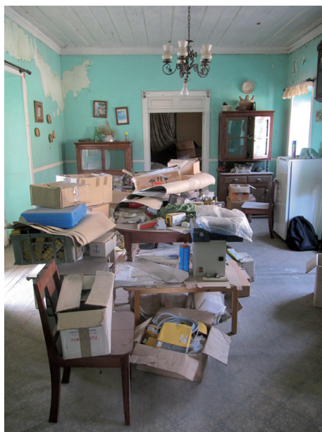
Figura 2. Espacio interior antes de las intervenciones de la primera fase del proyecto en el Museo de la Pesca. 2012 Archivo.

La primera fase del proyecto del MP consistió en un importante periodo de trabajo conjunto entre las tres instituciones. Naturalmente, surgieron puntos de resistencia y divergencia a nivel conceptual debido a la naturaleza de cada una de las instituciones participantes. Por tanto, es necesario destacar que es esta tensión, e inherente diversidad, entre las diversas visiones sobre la naturaleza del nuevo ente museístico, la que permite la gestión del MP como un proyecto muy singular en el contexto caboverdiano. Es, también, este fenómeno el que impide la creación de un grupo hegemónico que posea el control y el poder en el Museo.