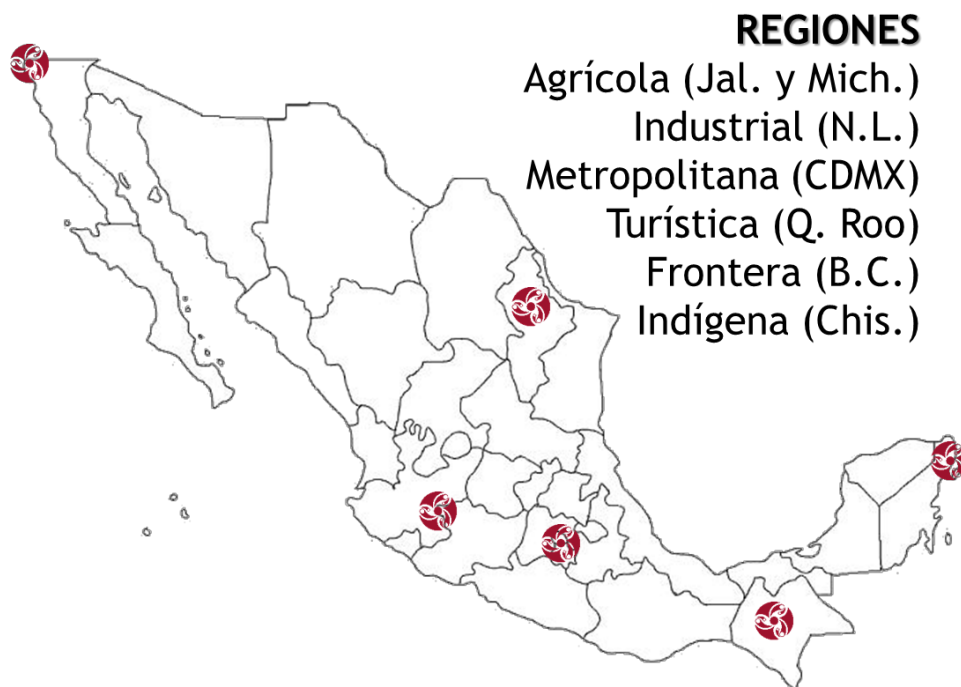
Mapa 1: Elaboración propia.

Para tal fin, se dedicó en promedio una semana para visitar cada una de las regiones. Se integraron equipos de entre 3 a 6 personas para realizar las visitas. Se procuró ir en pares a las entrevistas y cada equipo de entrevista tuvo asignado