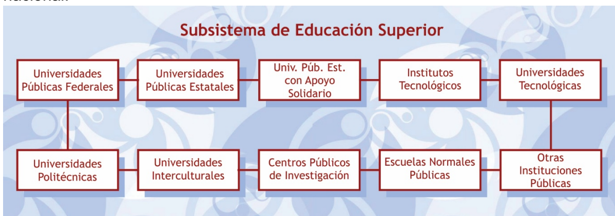
Diagrama 1. Elaboración propia a partir de Subsecretaría de Educación Superior.

La Educación Superior pública en México está integrada por diez subsistemas, los cuales tienen diferentes objetivos que se relacionan con los tipos de formación que ofrece cada institución y que se relacionan con el modelo del sistema educativo nacional.