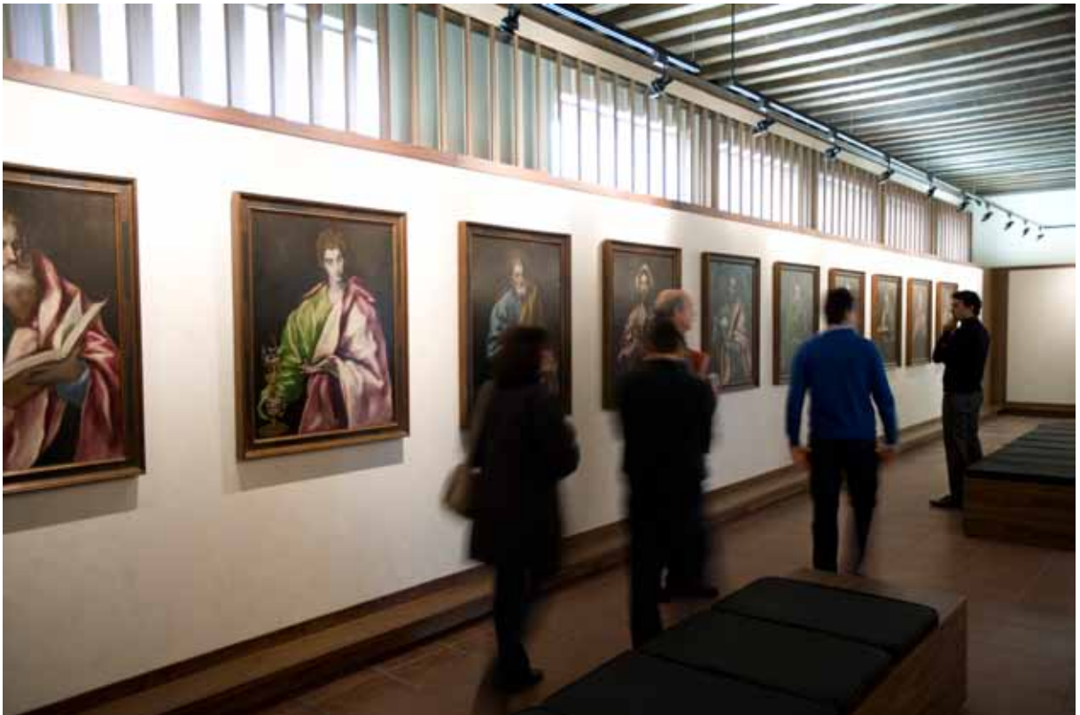
Museo del Greco.