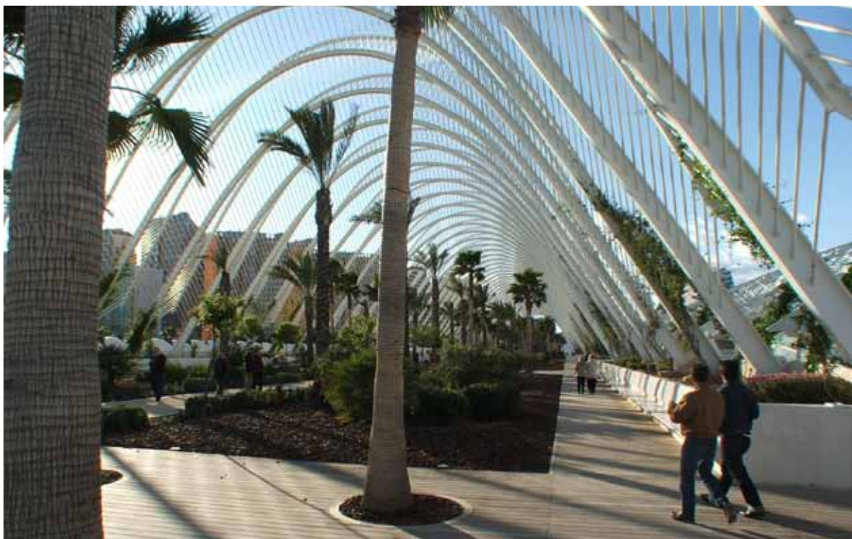
Pabellón cubierto Ciudad de las Artes y las Ciencias de Valencia. Fotografía: Luis Serrano. Licencia Creative Commons. Banco de imágenes y sonidos del Ministerio de Educación, Cultura y Deporte.