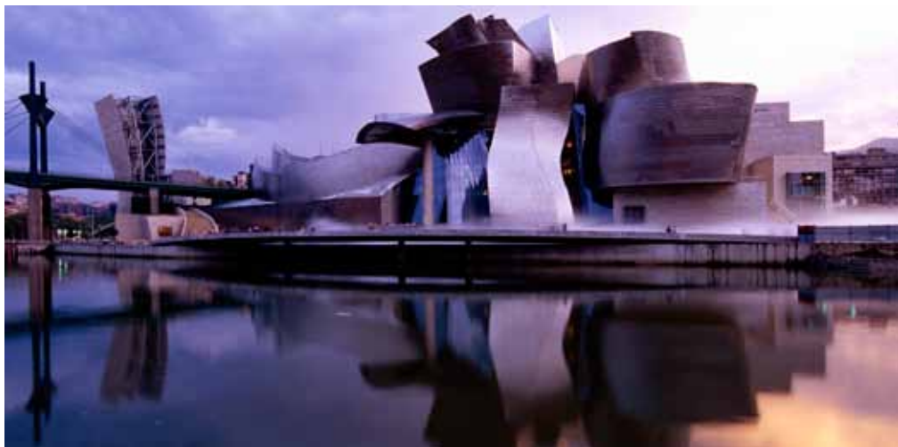
Guggenheim Bilbao. Licencia Creative Commons. Banco de imágenes y sonidos del Ministerio de Educación, Cultura y Deporte.