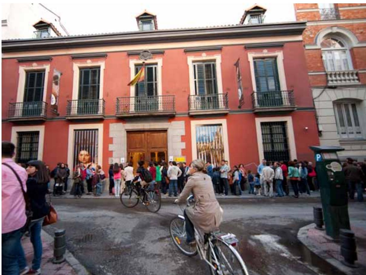
Museo Nacional del Romanticismo.

Si vas a Paris... haces la ruta, pero cuantos de Madrid han ido al Prado... en ese sentido somos un poco borregos... si vas de turista y no vas a los 4 museos de la ciudad,