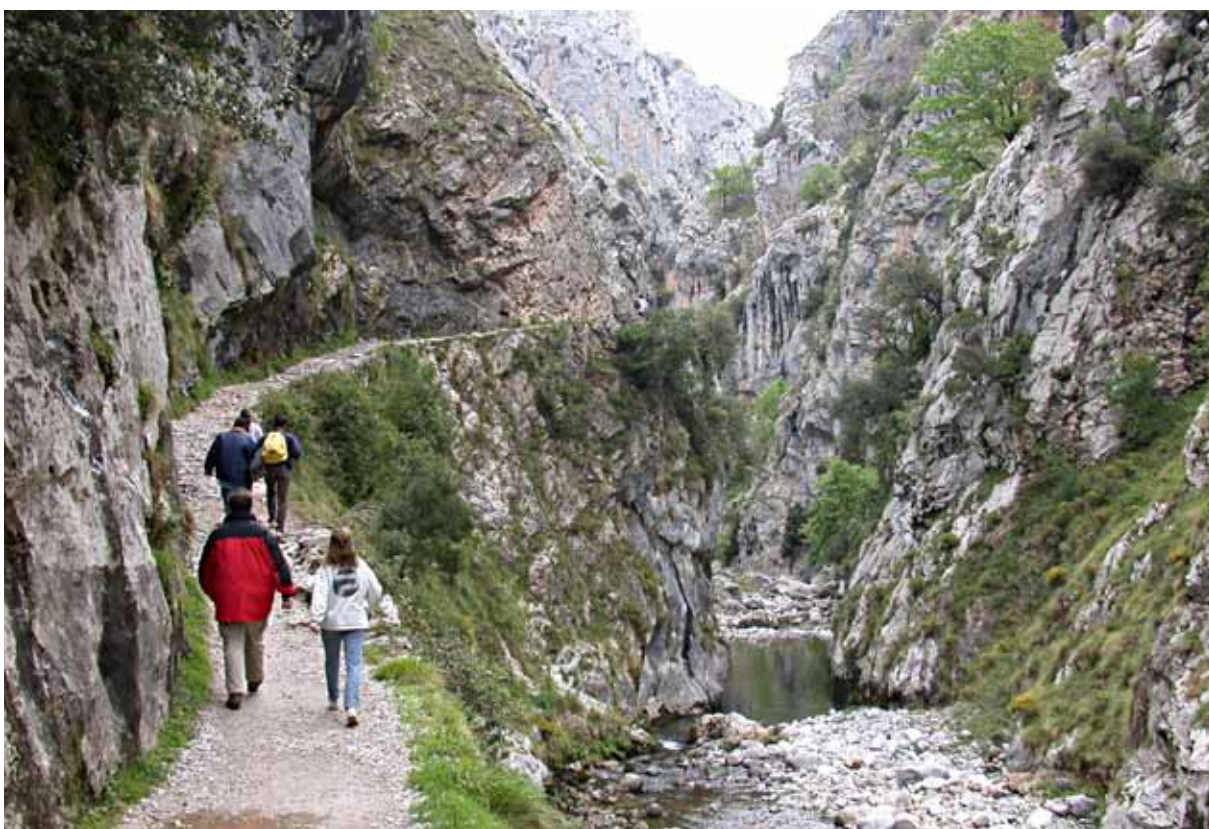
Arriba, ocio bares. Autor: Luana Fischer Ferreira. Licencia Creative Commons. Banco de imágenes y sonidos del Ministerio de Educación, Cultura y Deporte. Abajo, senderismo. Licencia Creative Commons. Banco de imágenes y sonidos del Ministerio de Educación, Cultura y Deporte.