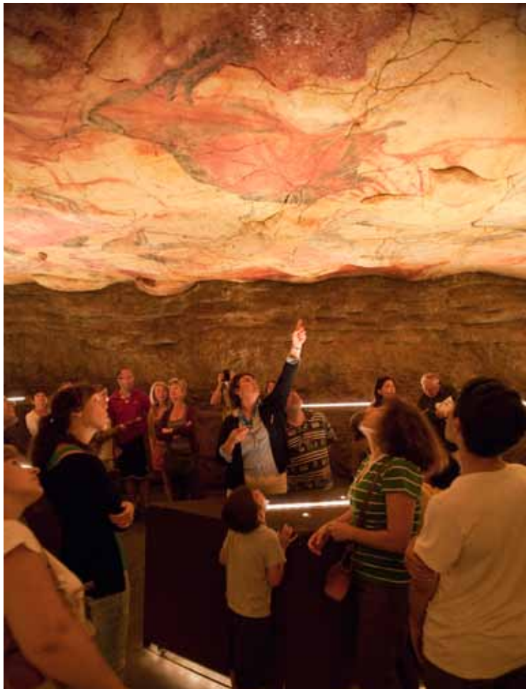
Museo Altamira Neocueva.

...es verdad que no se me hizo muy pesado porque iba con muchas ganas, pero se te puede convertir en un pasillo, pasillo, pasillo, sobre todo para los que no entendemos mucho. Si hubiera habido algo que te explicaran cosas interesantes, lo hubiera disfrutado más... porque tampoco puedo sacar mucho. (mujer, Sevilla).