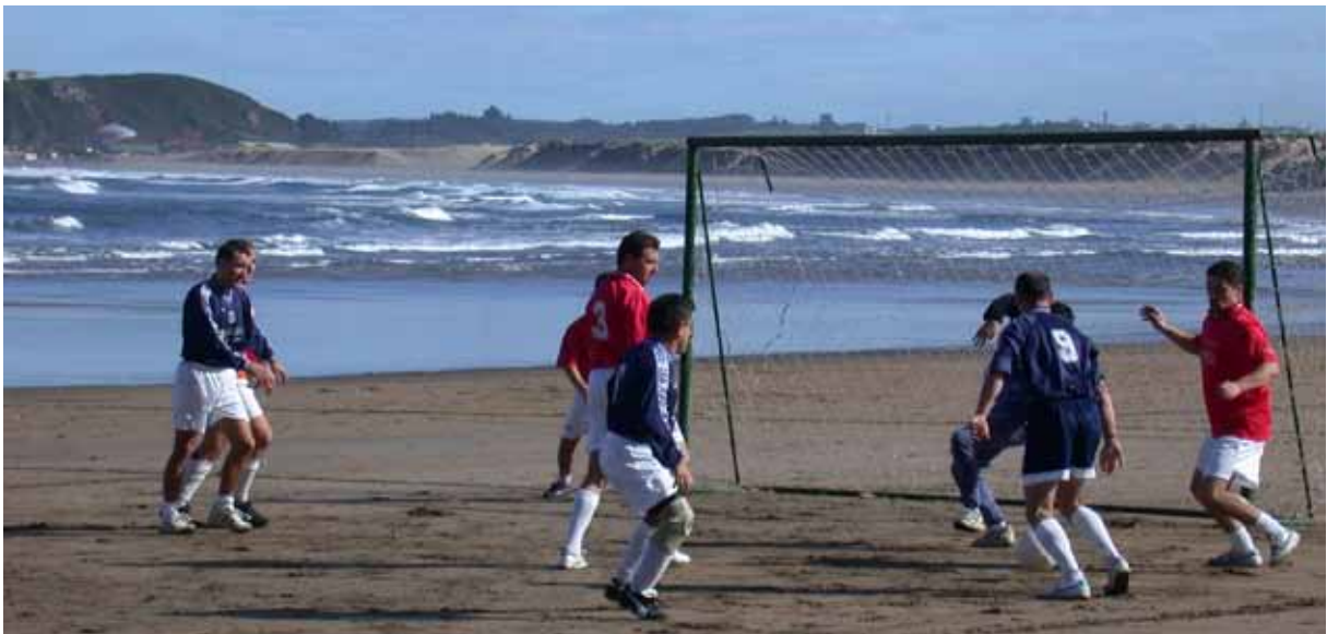
Fútbol en playa.

Yo tengo la obligación de que mi hijo juega en un equipo de fútbol, y siempre le vamos a ver. (mujer, Madrid).