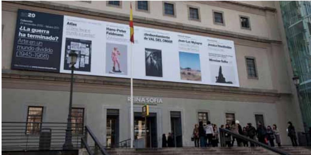
Fachada del Museo Nacional Centro de Arte Reina Sofía.