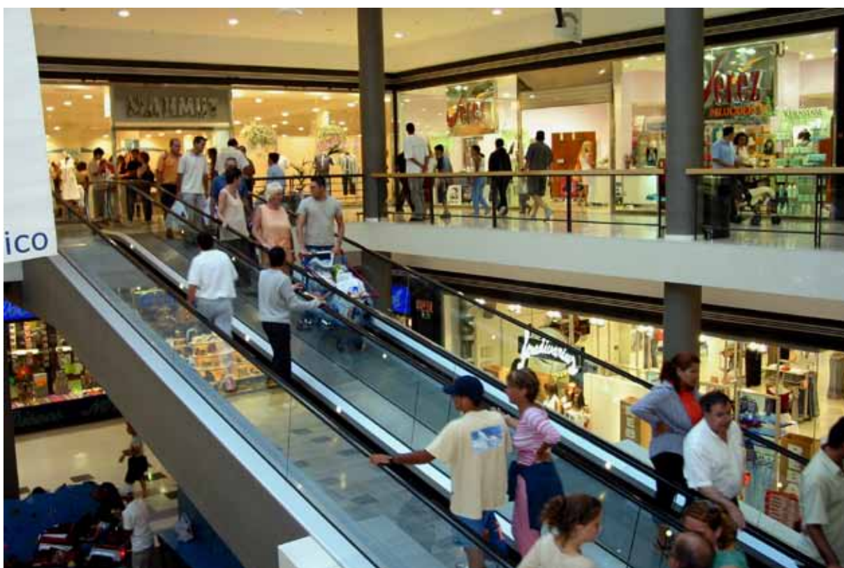
Centro Comercial Las Palmas. Autor: Ángel Hernández Gómez. Licencia Creative Commons. Banco de imágenes y sonidos del Ministerio de Educación, Cultura y Deporte.