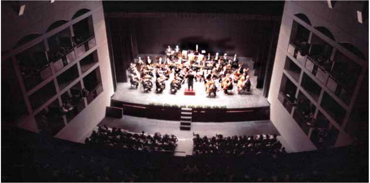
Concierto año nuevo. Badajoz.