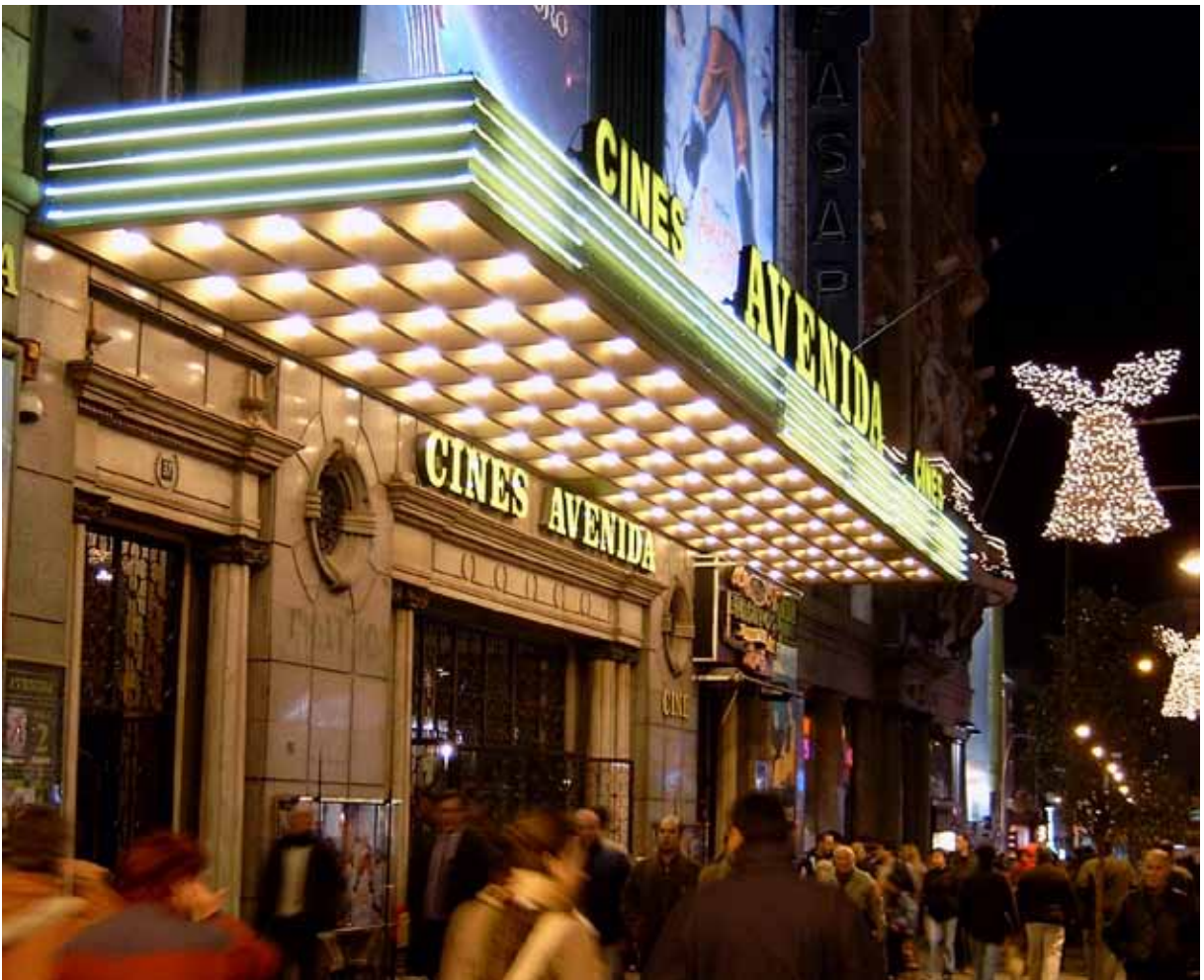
Cine Avenida. Licencia Creative Commons. Banco de imágenes y sonidos del Ministerio de Educación, Cultura y Deporte.