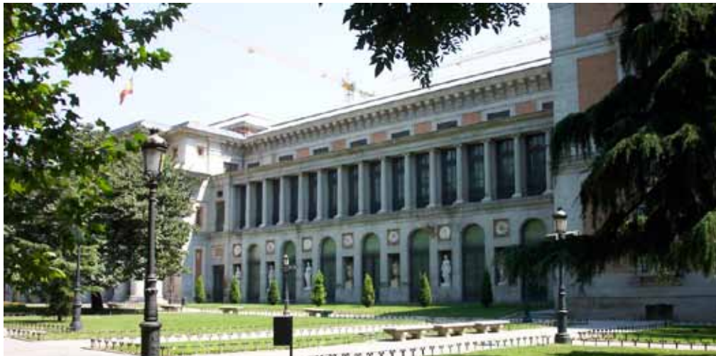
Museo del Prado. Fotografía Jesús Muñoz Conde. Banco de imágenes y sonidos del Ministerio de Educación, Cultura y Deporte.