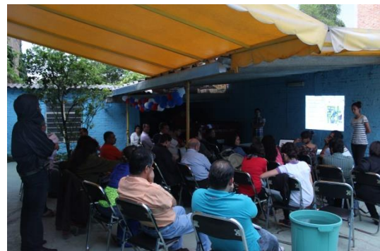
Capacitación con vecinos.