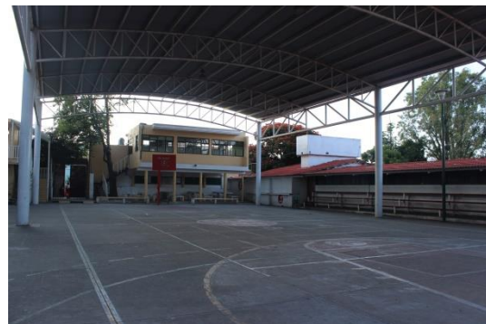
Patio de la Secundaria Flores Magón.

La infraestructura cultural se concentra en las escuelas públicas, destacando la Primaria Lázaro Cárdenas con un pequeño teatro y la Secundaria Flores Magón con un gran patio techado y un auditorio. Aunque cada escuela cuenta con un pequeño acervo de libros, todas se apoyan en la biblioteca municipal, antes ubicada en la unidad administrativa y ahora trasladada a la planta baja del Centro Cultural San Andrés.