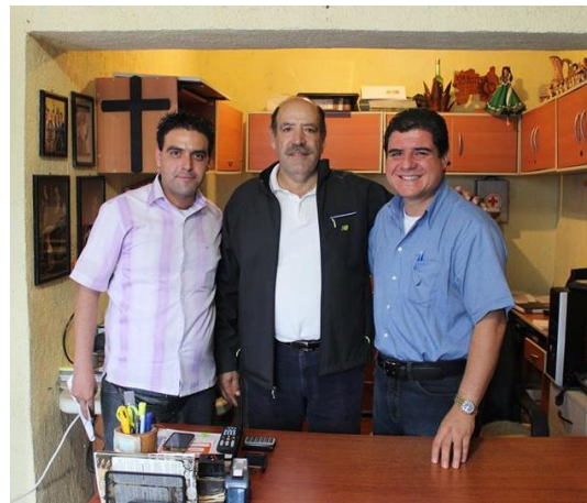
Comerciante, presidente de vecinos y director del mariachi Nuevo Tecalitlán.