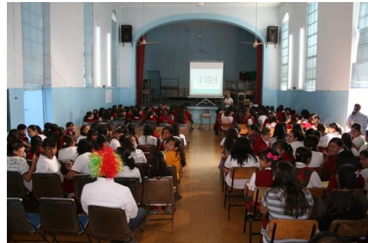
Teatro de la Escuela Lázaro Cárdenas.

Las instituciones educativas públicas y privadas han jugado un importante papel en el desarrollo cultural del barrio, concentrando la oferta de formación artística; el acceso de la población a esta oferta es desigual. Una alternativa de educación artística a la que accede buena parte de la población la ofrece el centro cultural de la Caja de Ahorro San Rafael.