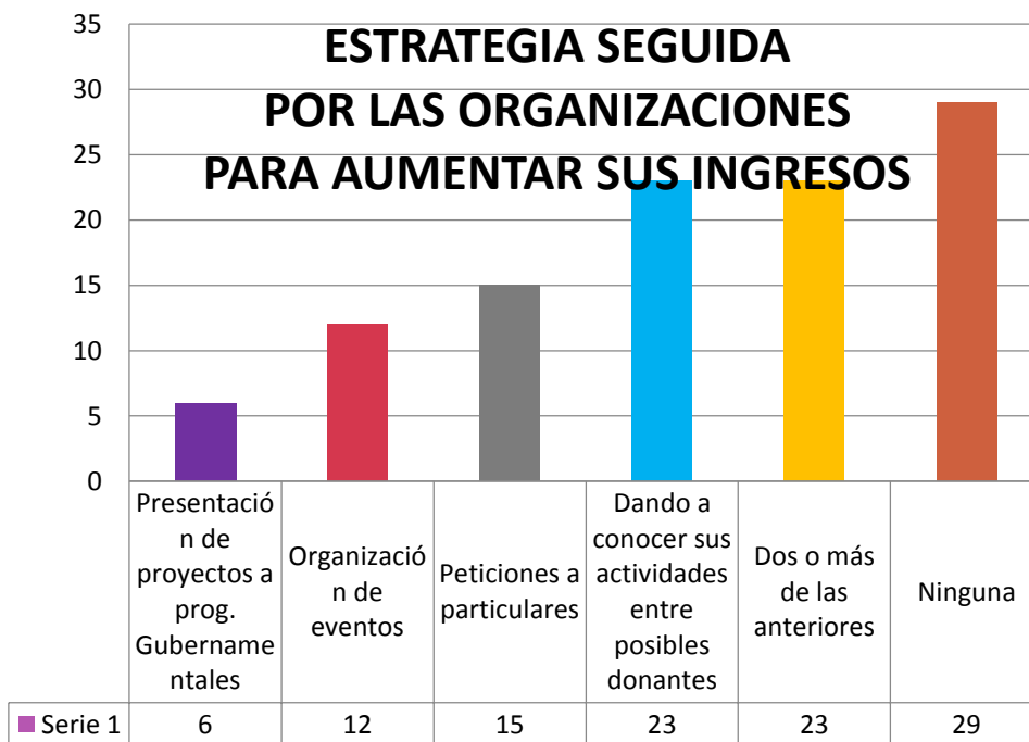
Gráfica núm. 2 Estrategias seguidas por las OSC para aumentar sus ingresos. Fuente: García (2005).

El 18% de las organizaciones no saben qué influencia puede tener en su obtención de recursos, contar con personal capacitado en procuración de fondos y un 41% considera que la influencia es poca o nula.