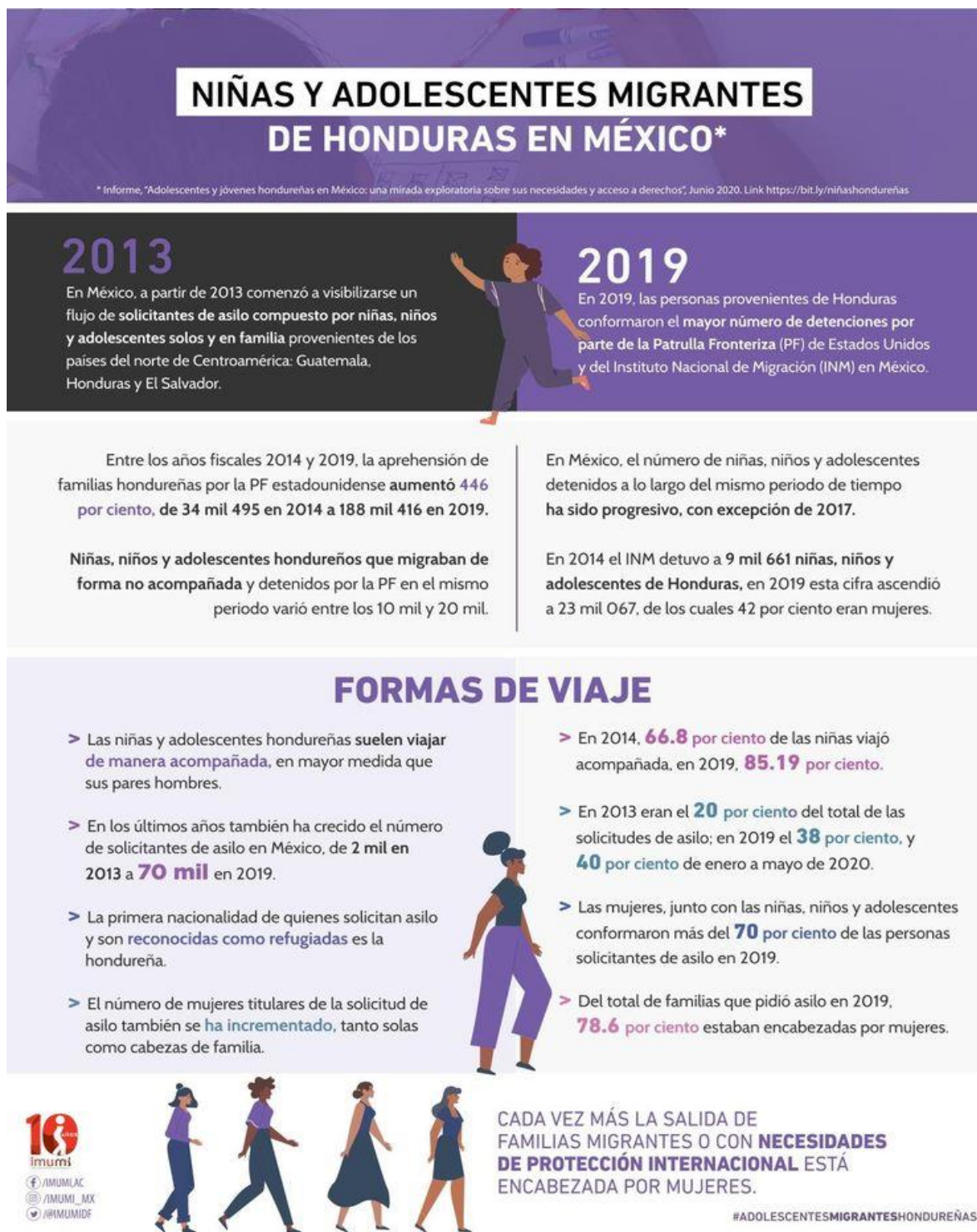
4Figura 4. “Niñas y adolescentes migrantes de Honduras en México”.

Nota: Fuente: Instituto para las Mujeres en la Migración (IMUMI). (2020). Adolescentes y jóvenes hondureñas en México: Una mirada exploratoria sobre sus necesidades y acceso a derechos