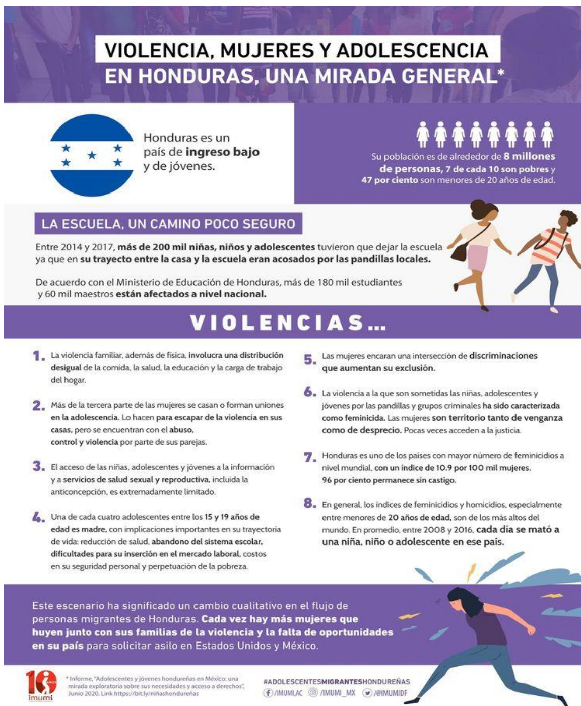
3 Figura 3. “Violencia, mujeres y adolescencia en Honduras, una mirada general”.

Nota: Fuente: Instituto para las Mujeres en la Migración (IMUMI). (2020). Adolescentes y jóvenes hondureñas en México: Una mirada exploratoria sobre sus necesidades y acceso a derechos