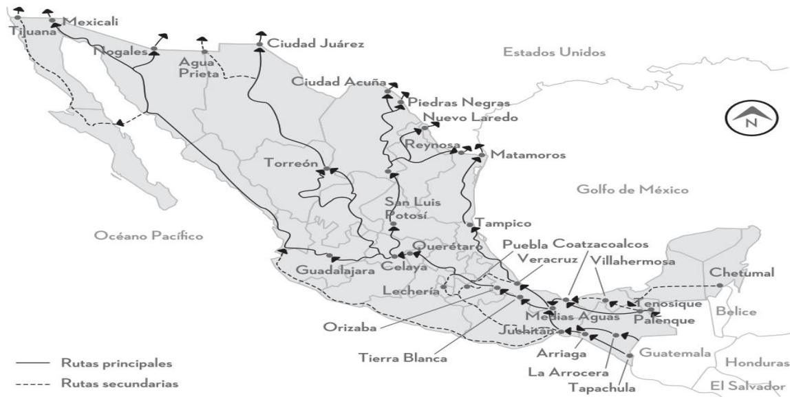
Ilustración 2 Rutas de tránsito migratorio por México.

Nota: Fuente: “Procesos migratorios en el occidente de México” González-Árias, Aikin-Araluce (coord.) (2017).