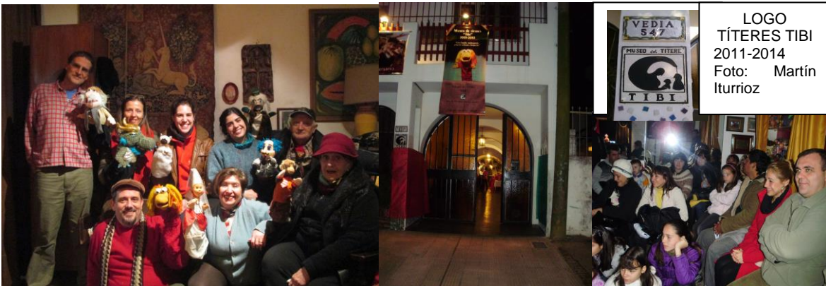
Familia Iturrioz- Museo del Títere TIBI- Resistencia- Chaco- Argentina – 2013- Foto: Martín Iturrioz