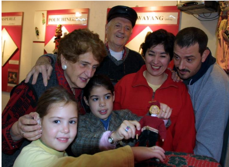
Familia Iturrioz- Inauguración del Museo del Títere TIBI- Resistencia- Chaco- Argentina – 2001- Foto: Diario Norte