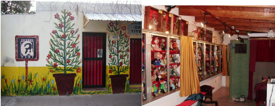
Imágenes de entrada e Interior del Primer Edificio del Museo del Títere TIBI- Vedia 498 – Resistencia – Chaco – Argentina – 2001- 2010