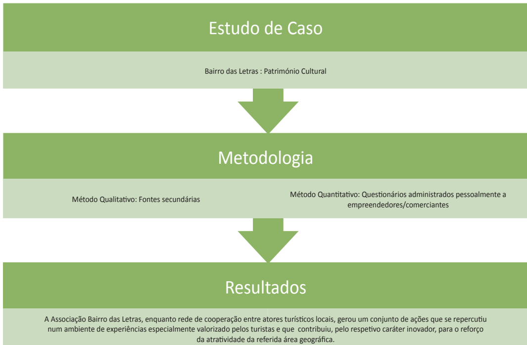
Figura 3: Estudo de Caso 2

As novas tendências da indústria do turismo têm propiciado o aparecimento e o crescimento da oferta de turismo urbano de experiências a que os chamados “bairros” dão resposta e de que o Bairro das Letras em Madrid, é exemplo (Henche & Carrera, 2017). O Bairro das Letras situa-se no centro de Madrid, constitui o cenário de maior concentração de talento da história da literatura universal e aí podem encontrar-se alguns dos recursos patrimoniais de destaque da capital, inclusive o Museu Nacional do Prado. A oferta cultural, comercial e de “ócio” do Bairro das Letras assenta numa adaptação e remodelação de uma zona histórica, capaz de proporcionar novas experiências aos turistas com novas necessidades e para o que muito contribuiu o associacionismo e as redes de colaboração do pequeno comércio e empreendedores do local, junto com instituições culturais que com eles se relacionam. A Associação de Comerciantes do Bairro das Letras, em particular, agrega empreendedores e comerciantes localizados na área, com capacidade de coordenação e agilidade necessárias para a dinamização de um conjunto de iniciativas e atividades, com um timbre único e diferenciador, evidenciando, dessa forma, um considerável nível de inter-relação e colaboração entre si.