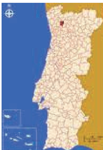
Figura 1: Localização da RPI