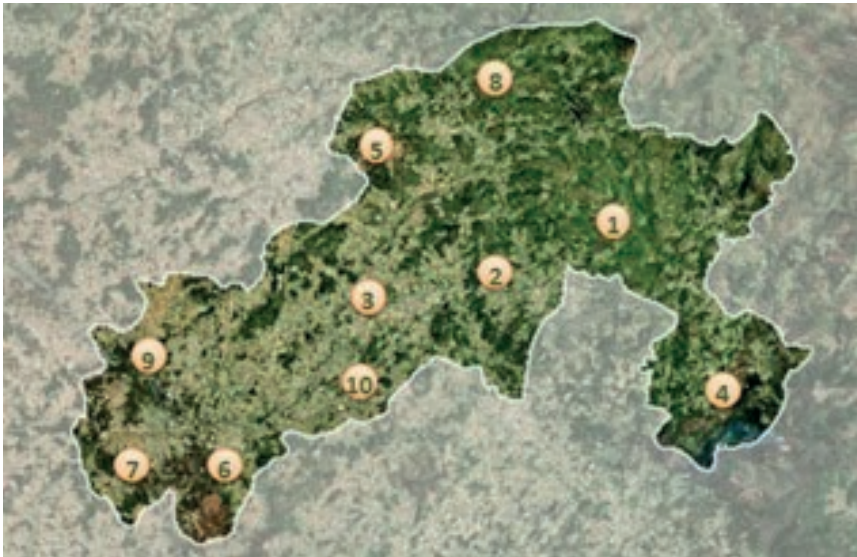
Figura 2: Rota do Património Industrial do Vale do Ave

Fonte: http://www.cim-ave.pt/index.php/quem-somos/municipios