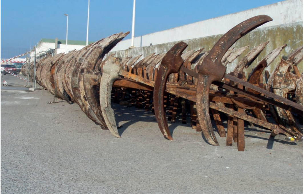
Anclas de almadraba.

La pesca del atún mediante este sistema se remonta a la antigüedad prerromana y lógicamente ha evolucionado a lo largo del tiempo, dando lugar a distintos tipos de almadraba, principalmente la de tiro o vista , la de monteleva y la almadraba de buche .