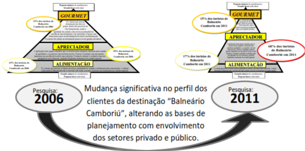
Figura 2: Visualização das alterações do perfil dos clientes de Balneário Camboriú entre as pesquisas de 2006 e de 2011.