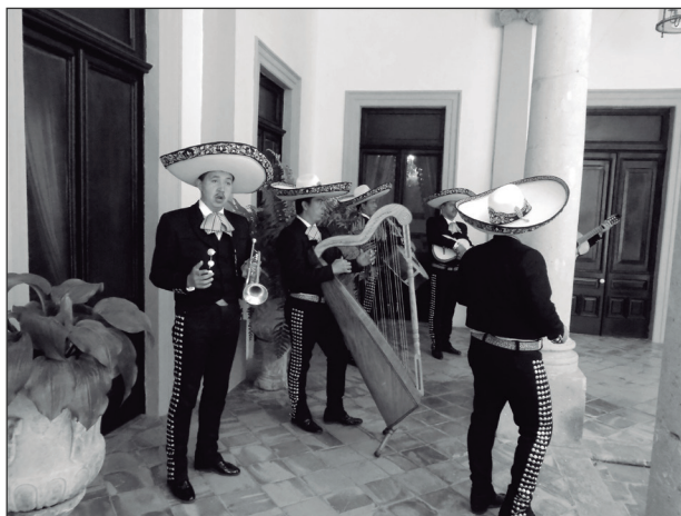
Conjunto de mariachi “moderno” que incorpora la trompeta a la dotación instrumental del mariachi tradicional. Fiesta familiar en Cocula.

En este sentido resulta de particular relevancia la permanencia tanto del Encuentro Internacional del Mariachi y la Charrería como del Concurso Estatal del Mariachi Tradicional ya que podría propiciar un mayor acercamiento entre los grupos musicales de mariachi dispersos por el mundo y sus raíces originarias. Sería fundamental también seguir escuchando las voces de los grupos de mariachi como portadores de esta manifestación cultural ya que podrían aportar mucho al Plan de Salvaguardia que tiene que ser actualizado permanentemente y, ¿por qué no? continuar ampliando la declaración de conocimiento libre e informado de que la música de mariachi y ellos mismos forman parte de uno de los elementos que figuran en la “Lista Representativa del Patrimonio Cultural Inmaterial de la Humanidad”.