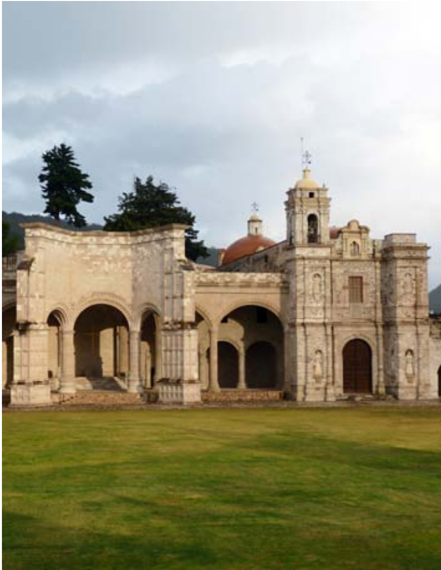
Capilla abierta y ExConvento de San Pedro y San Pablo Teposcolula, antiguo convento dominico del siglo XVI, Mixteca Alta Oaxaca México.