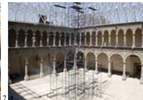
Fig. 7. Ex Convento de la Merced. La Jornada. 14 de febrero de 2013.