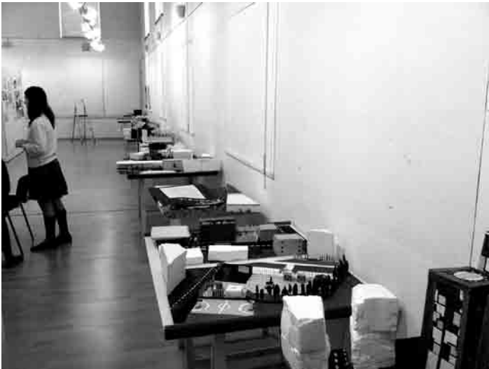
Figura 1 · Alumnos trabajando en los proyectos de su ciudad ideal.