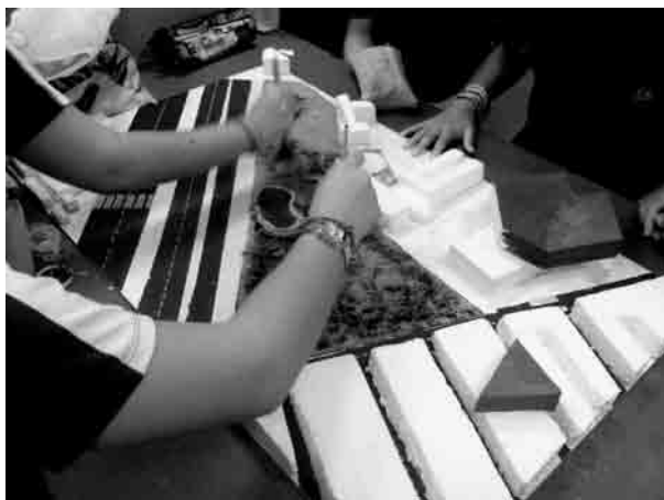
Figura 3 · Ejemplo de uno de los bocetos realizados en el desarrollo de los proyectos.