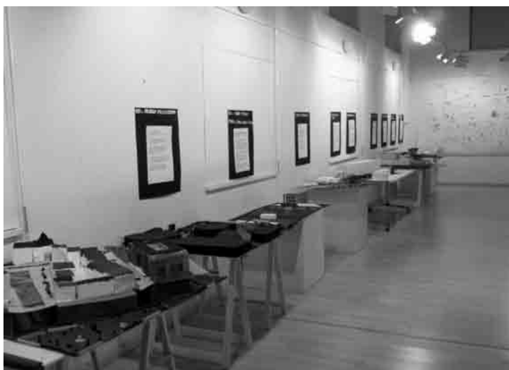
Figura 6 · Detalle de uno de los proyectos.